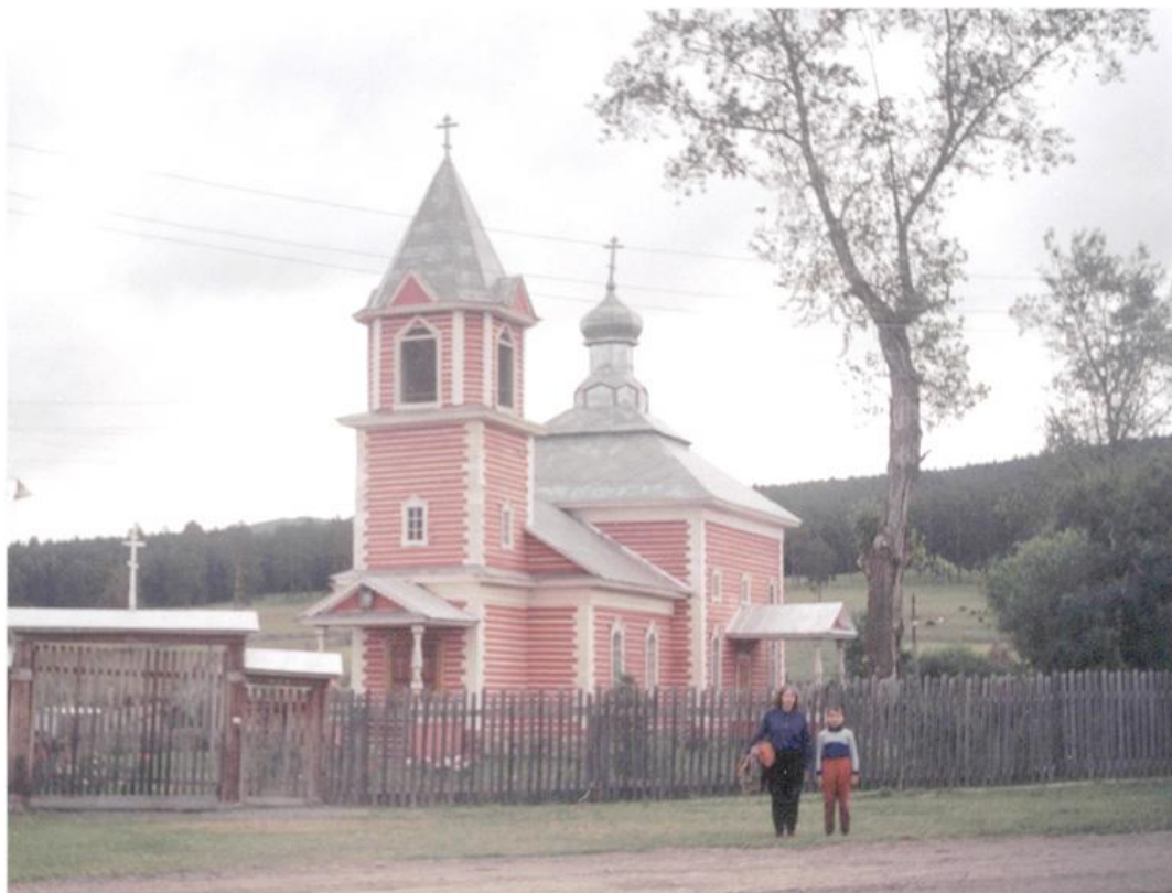
Фото 11. Церковь в с. Тюлюк.

Утром последние сборы, пара км по дороге и мы на автобусной остановке. В 9 00 автобус на Катав-Ивановск. Доехали до г. Юрюзань, вышли на "автостанции". Это какой-то тупик, что, в принципе, видно по карте. Автобусы заезжают туда редко и без всякой гарантии. Лучше рассчитывать на автобус Катав-Ивановск – Вязовая, идущий почти каждые два часа. Нам повезло – мы углядели неожиданный автобус, хотя он остановился буквально на пару минут на весьма приличном расстоянии от кассы.