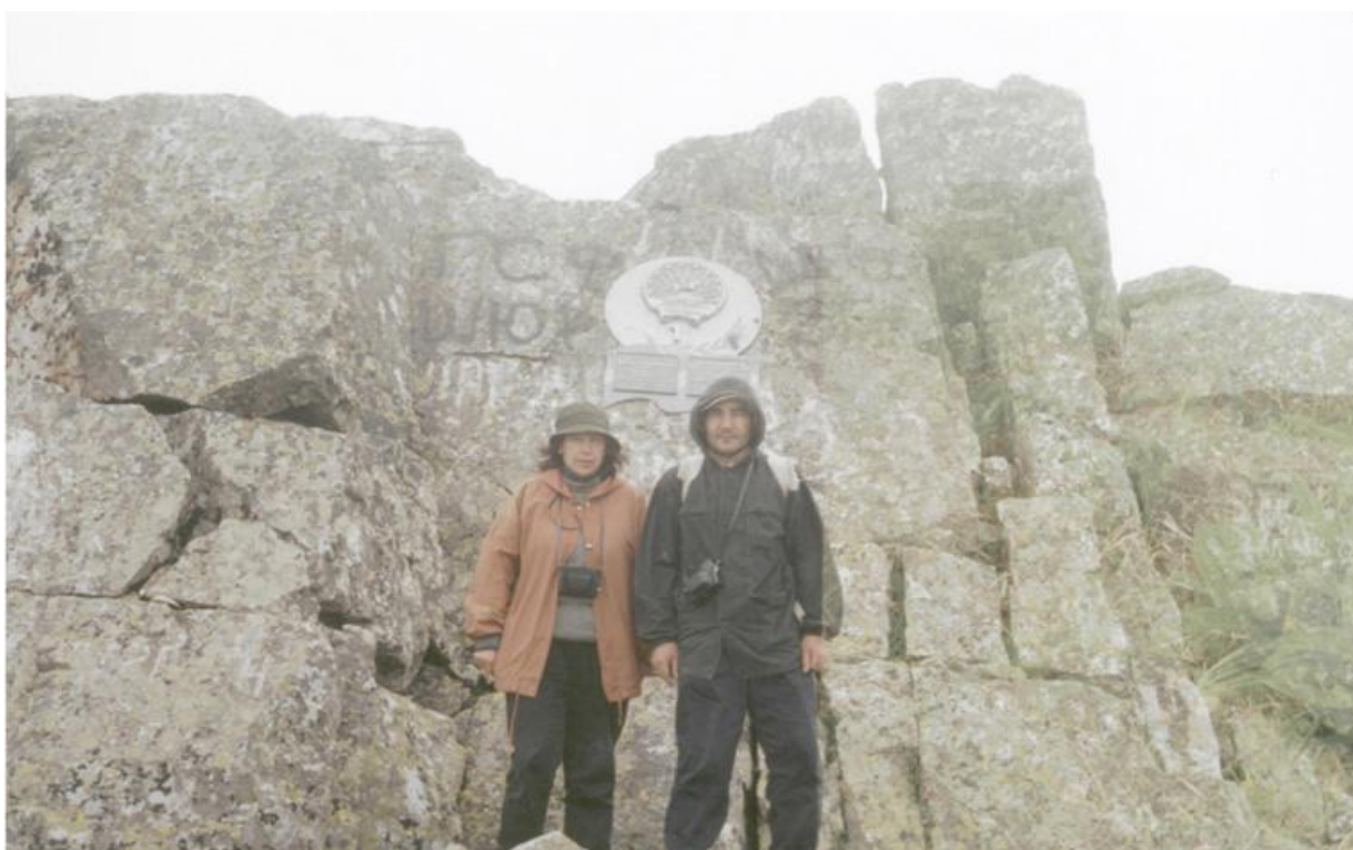
Фото 10. Герб Башкортостана на в. Б. Ирмель.