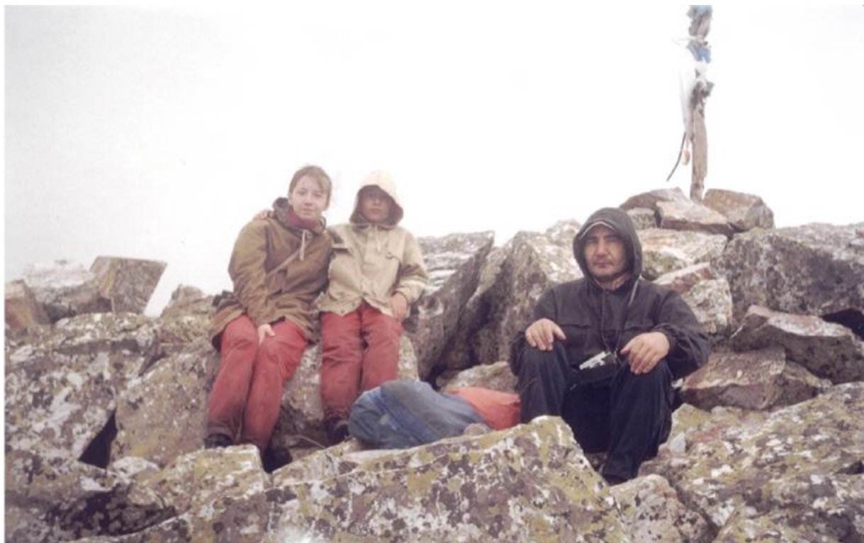
Фото 9. На вершине Б. Ирмель.

г. Бол. Ирмель (восхожд., 1582) – устье р. Карачайка. 12.5 км, 8 ч.х.в. +300 м, –1020 м.