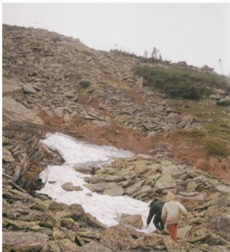
Фото 8. Снежник под вершиной Б. Ирмель.