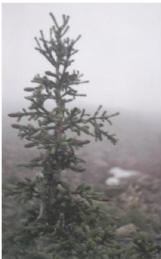
Фото 7. Карликовая ель.