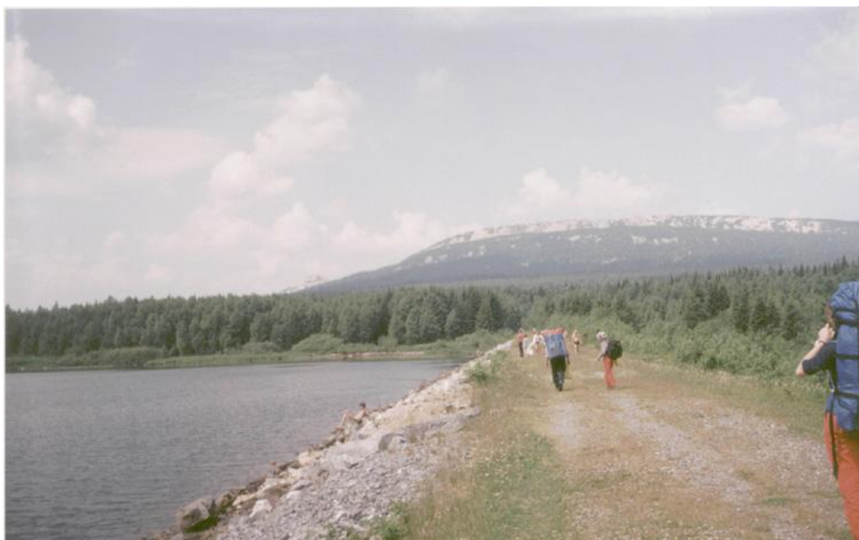
Фото 2. На плотине оз. Зураткуль. Вид на хр. Зураткуль.

можно остаться на ночлег, но мы ограничились обедом и купанием. Много отдыхающих (фото 2). По азимуту 190 град. видна вершина (Нургуш, 1406). После обеда обходим озеро по западной стороне. Дорога заболочена, камни. Около домика "кардон Шаровский" – выход к берегу озера (300 м). Несколько далее пересечение с дорогой к озеру. Возможно, по ней кратчайший путь к Ю.-З. концу озера. Мы придерживаемся первоначальной дороги и упираемся в хорошо накатанную дорогу и по ней, перевалив через довольно-таки крутой отрог, примерно минут через 40 оказываемся у озера, чуть не доходя до места впадения реки. Берег слегка заболочен, но для ночлега и купанья вполне приемлим. Пару раз невысоко над поверхностью воды пролетели большие белые птицы, вероятно гуси.