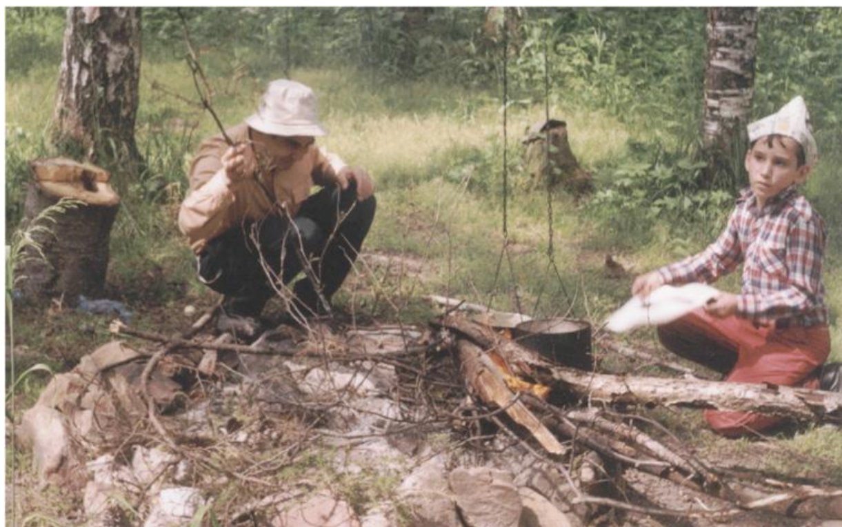
Фото 3. Обед на тропе на Нургуш.

группы школьников, которую мы встретили на подъеме. Школьники предпочитают двигаться по звериным (кабанным) тропам или азимуту и заметно петляют. Однако, как оказалось, больше каких-либо следов тропления туристами мы не встретим до самого подъема на Иремель. Двигаемся по азимуту; камни, ручьи, болота, и снова выходим на нашу дорогу. Хорошее место для ночлега около пересечения дороги с р. Б. Кыл (1 м шириной). Вода вкусная и не очень холодная.