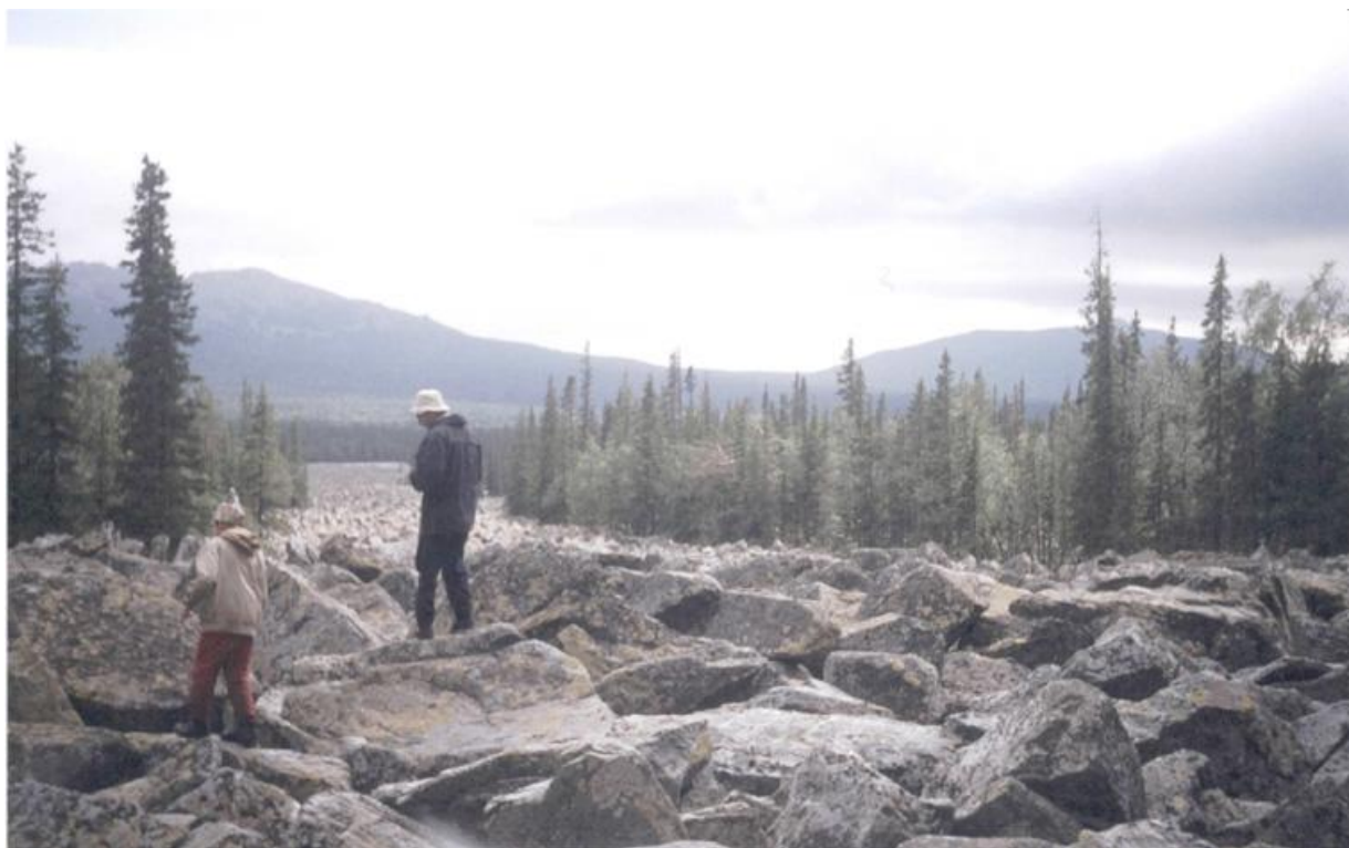
Фото 6. Курумник.