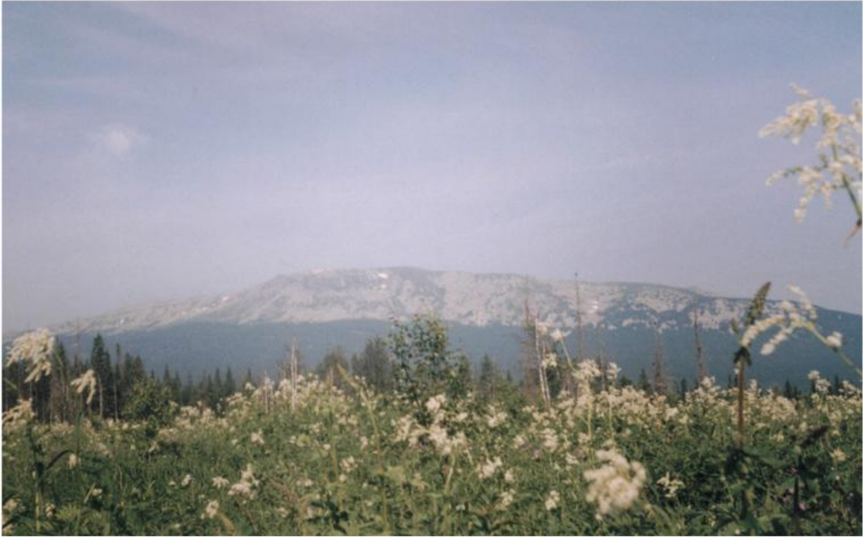
Фото 4. Хр. Нургуш.