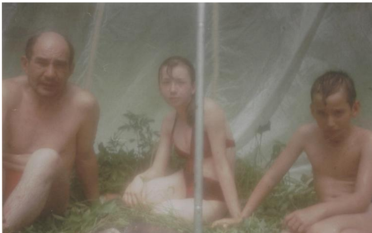
Фото 5. Баня.